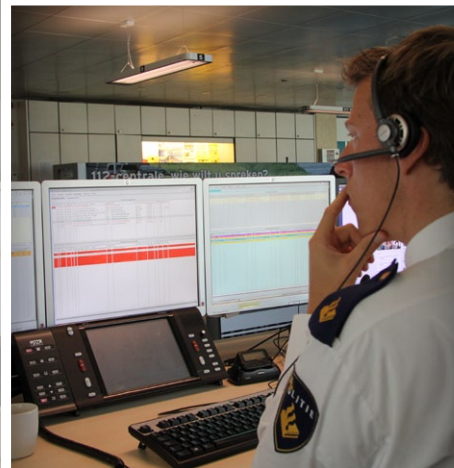
Van informatie naar slimme informatie