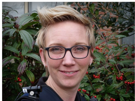
Zoonlief toch niet zo lief