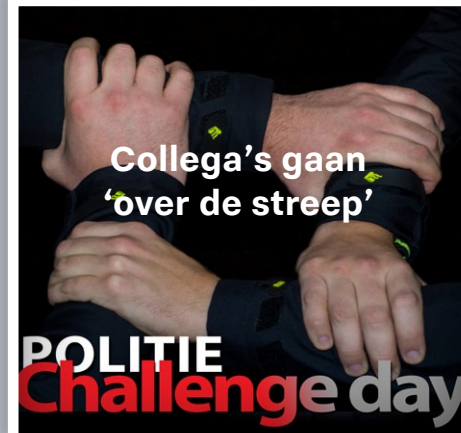
Collega's gaan 'over de streep'