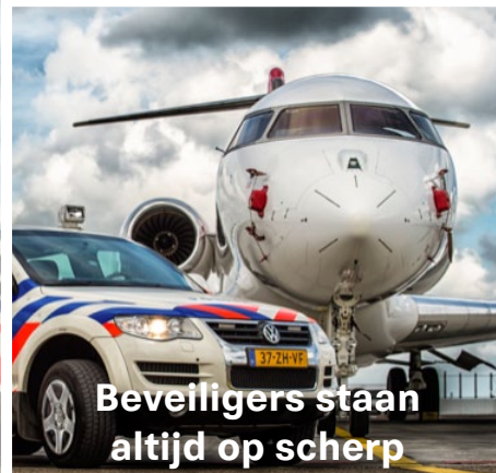
Beveiligers staan altijd op scherp