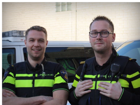
Afpakken in Blauw