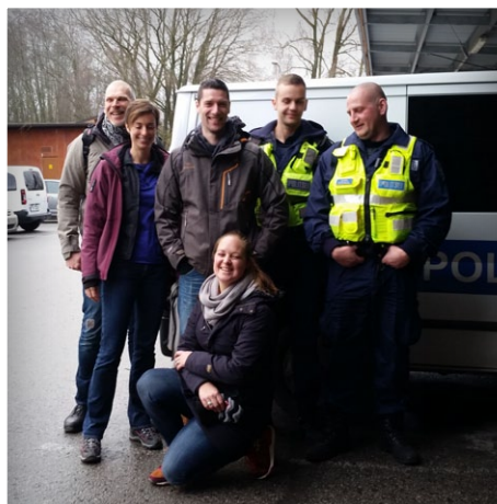
"Ik had het voor geen miljoen willen missen"